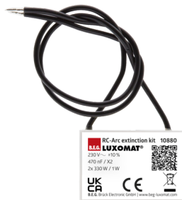
Kit Anti-arc Ref.: 10880

Dimensions: Ø 164 x 143 mm Résistance aux chocs: IK09 Boîtier: panier en acier revêtu