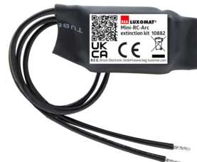
Mini-Kit Anti-arc Ref.: 10882

Tension: 230 V AC ±10% Dimensions: 38 x 12 x 26 mm Niveau de protection: IP20 / Classe II