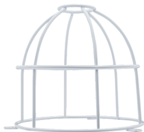
Panier de protection BSK (Ø 164 x 143 mm) Ref.: 92467

Dimensions: Ø 164 x 143 mm Résistance aux chocs: IK09 Boîtier: panier en acier revêtu