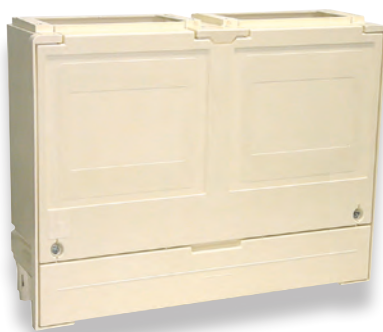
Socle double S20 (N006)