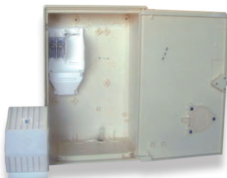
Coffret S20 MONO/TRI avec embase de téléreport (P533)