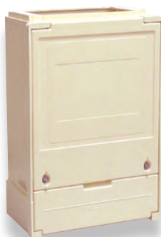
Socle simple S20 (N005)