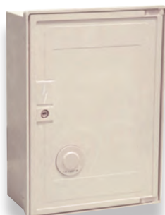
Coffret S20 nu avec embase de téléreport (N002)