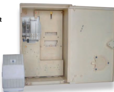
Coffret S20 MONO/TRI + panneau avec embase de téléreport (P535)