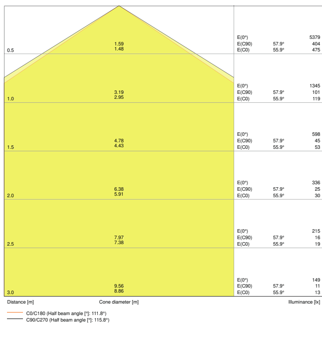
LDC typ cone