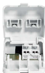
Alimentation avec connecteur rapide repiquable