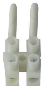
CONNECTION PAR DOMINO