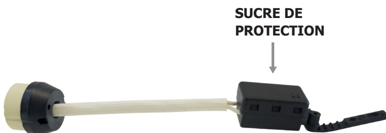
DOUBLE CÂBLE GAINÉ