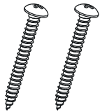
Vis pour chevilles Rawl plug screws