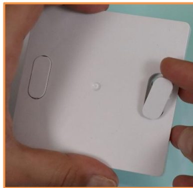
Insérer les capuchons de finition dans leur logement