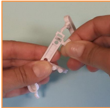
Détacher chaque élément