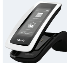
Nina® (dont timer)

* Se référer à la notice pour l'activation