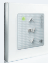
Smoove® origin io (à partir de l'indice B)