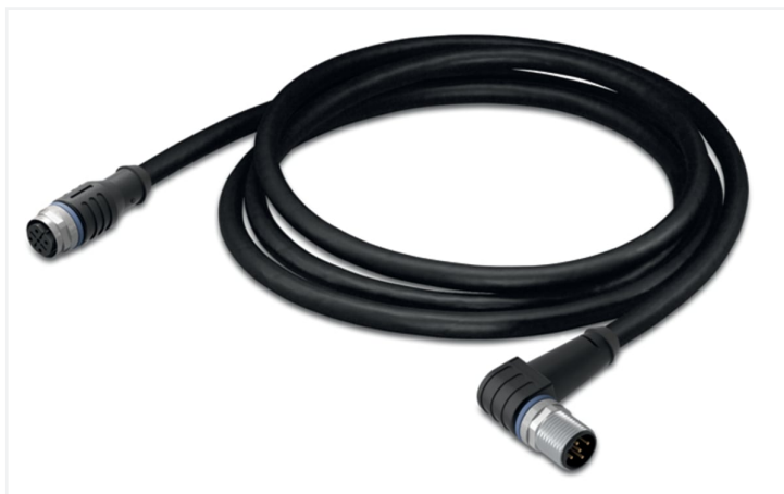
Identique à la figure