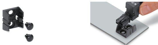
Fixation de la plaque de montage avec ri- vets de fixations