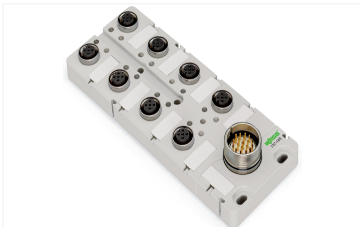
Identique à la figure