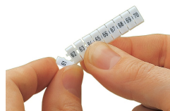
Détachement d'une étiquette de la bande de marquage WMB, pour les largeurs de bornes supérieures