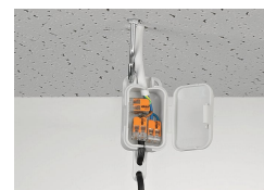
Connexion des luminaires suspendus dans les faux plafonds