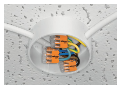
Distribution d'éclairage dans les plafonniers