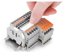
Encliquetage d'une bande de marquage WMB dans le logement de marquage