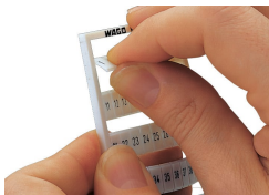
Détachement d'une bande de la carte WMB.