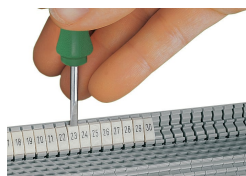
Encliquetage d'une bande de marquage WMB dans le logement de marquage du double porte-étiquettes