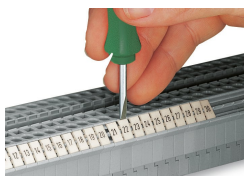
Encliquetage d'une bande de marquage WMB dans le logement de marquage