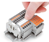
Encliquetage d'une bande de marquage WMB dans le logement de marquage