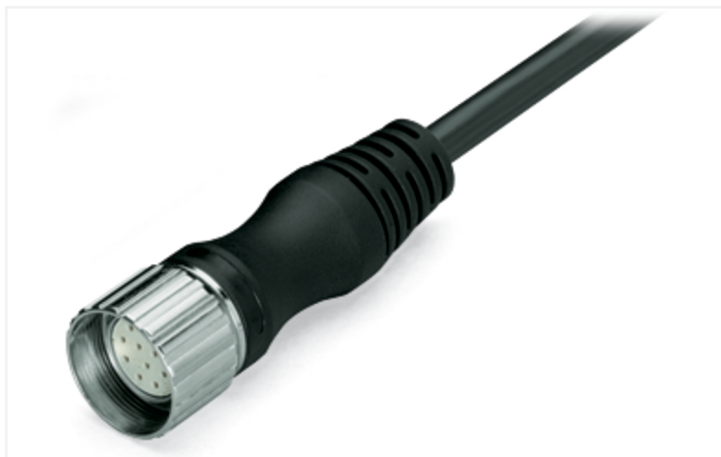
Couleur: ■ noir

Pin 9, 11, 12: 1.00 mm 2 ; Pin 1 - 8: 0.34 mm 2