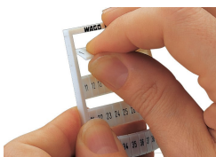
Détachement d'une bande de la carte WMB.