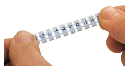
Pose d'une bande de repérage WMB