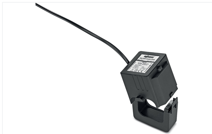
Identique à la figure