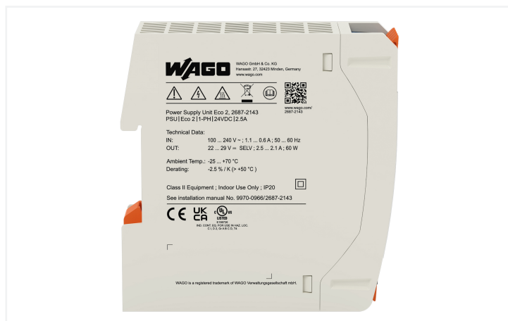
Identique à la figure