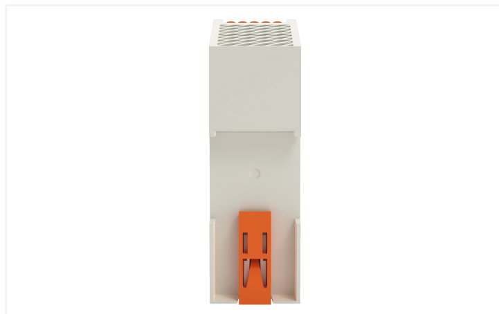
Identique à la figure