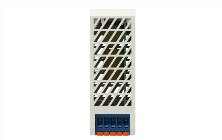
Identique à la figure