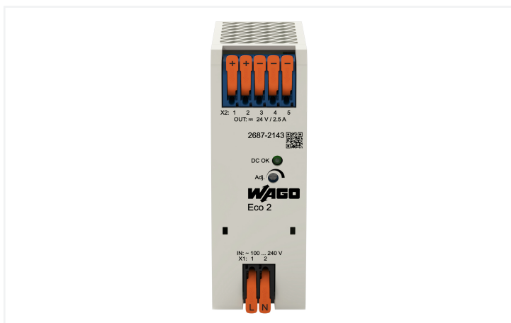
Identique à la figure