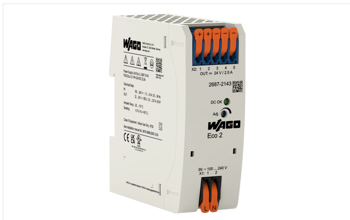
Identique à la figure